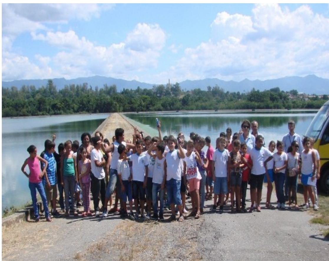
Visita de alunos do 5º ano das escolas municipais Professor Ruy Brasil Pereira, Vovó Fiuta, Governador Mário Covas e Professora Leda Maria Bilard de Carvalho na Estação de Tratamento de Esgoto da SABESP (2014)

Abordam-se também, questões sobre saneamento básico, como a importância e necessidade das estações de tratamento do esgoto e como a boa manutenção destes equipamentos, influenciam na qualidade das águas.